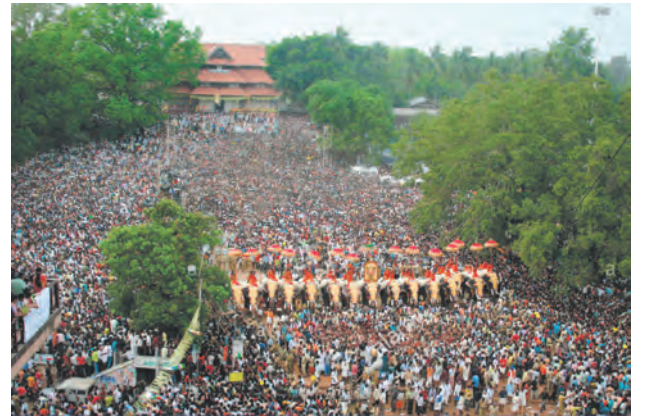
त्रिसूरपूरम उत्सव (केरळ)

देशभरातील श्रद्धास्थानांवरून भारतातील धार्मिक एकता ध्यानात येते. भारत आणि परदेशातील लोक भारतातील हिंदूंच्या धार्मिक स्थळी गर्दी करतात. उत्तरेकडील बद्रीनारायण, पश्चिमेकडील द्वारका, दक्षिणेकडील रामेश्वरम आणि पूर्वेकडील पुरी; शिखांचे अमृतसरमधील सुवर्ण मंदिर, वेलाकन्नी येथील ख्रिश्चन चर्च, कोची किल्ल्यावरील ज्यूंचे उपासना स्थळ, मुस्लीम फकिरांच्या समाधी आणि अजमेर दर्गा अशा भारतातील आणि जगातील स्थळांना पर्यटक भेटी देतात. कुंभमेळा, मदर मेरीची मेजवानी, कुरुक्षेत्र उत्सव, गणपती, दुर्गा पूजा, त्रिसूरपूरम या स्थळांना जगभरातील सर्व श्रद्धांचे अनुयायी दरवर्षी भेटी देतात. व्यक्तींच्या धार्मिक पद्धती, धार्मिक उत्सव आणि सण वेगवेगळे असले तरी त्यातून भारतासारख्या अवाढव्य देशाची धार्मिक एकता प्रकट होते.