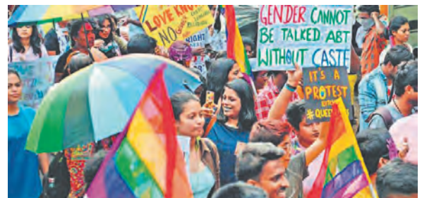
लिंगभाव आधारित विविधता