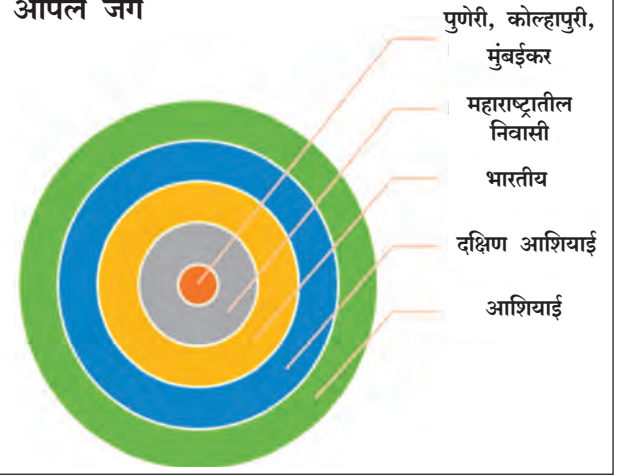
प्रादेशिक अस्मितांचे स्तर

प्रदेश म्हणजे देशातील भौगोलिक एकक आहे. उदाहरणार्थ, सात राज्ये असलेला ईशान्येकडील प्रदेश. ज्याला 'सेव्हन सिस्टर्स' असेही संबोधतात. तथापि, राज्यांतर्गत देखील काही प्रदेश असतात. उदाहरणार्थ, महाराष्ट्र राज्यातील प्रदेश पुढीलप्रमाणे आहेत - कोकण, विदर्भ, खानदेश, मराठवाडा आणि पश्चिम महाराष्ट्र.