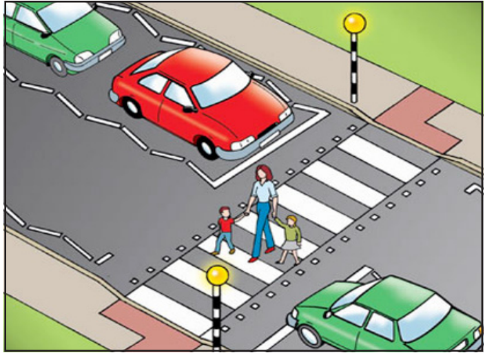
चित्र-8.2 जेब्रा क्रॉसिंग

शहरों में सड़क पार करते समय यातायात को सुगम बनाने के लिए सिग्नल्स (आने जाने का रास्ता) की व्यवस्था होती है। हरा प्रकाशवाला सिग्नल हमें आगे चलने का संकेत देता है। सड़क के दोनों किनारों पर बने फुटपाथ पर चलना ज्यादा सुविधाजनक व आसान होता है। संकेत मिलते ही सड़क पार करने हेतु सड़क पर बनी zebra crossing होती है, जिन्हें हम zebra crossing कहते हैं। जेब्रा क्रॉसिंग zebra crossing वालों के लिए निर्धारित होती है। सड़क पर बने यातायात के विभिन्न संकेत न केवल हमारी सुविधा के लिए होते हैं, बल्कि हमारी यात्रा को सुरक्षित व सुखद बनाने में हमारी सहायता करते हैं।