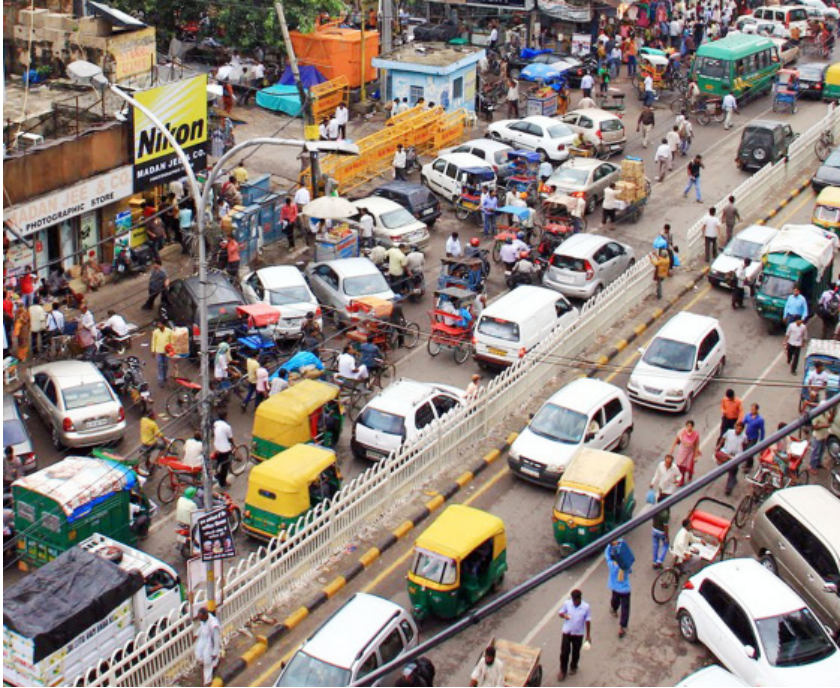
चित्र-8.1 अव्यवस्थित यातायात

विद्यालय जाते समय आपने परिवहन के विभिन्न साधनों जैसे साइकिल, रिक्शा, स्कूटर, मोटर साइकिल या कार, बस, ट्रक आदि को सड़क पर चलते देखा होगा। शहरों में वाहनों की अधिकता ने आवागमन को कठिन बना दिया है।