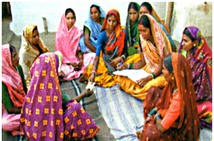
चित्र-8.4 स्वसहायता समूह की बैठक