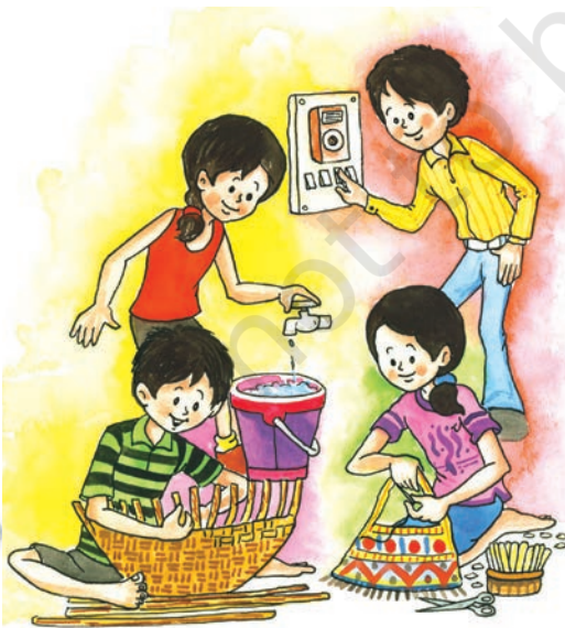
4 संसाधन एवं विकास

सततपोषणीय विकास संसाधनों का सावधानीपूर्वक उपयोग ताकि न केवल वर्तमान पीढ़ी की अपितु भावी पीढ़ियों की आवश्यकताएँ भी पूरी होती रहें।