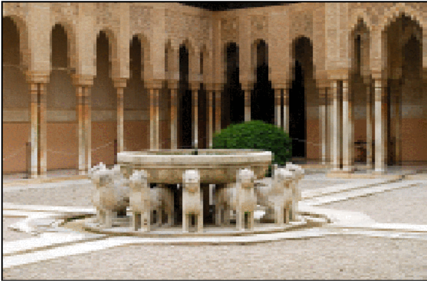
അൽ ഹറ കൊട്ടാരത്തിലെ കോർട്ട് ഓഫ് ലയ്ൻസ്

കൊർദോവയിൽ അബ്ദുൽറഹ്മാൻ മൂന്നാമൻ അൽ സഹറ നഗരവും അൽ സഹറ കൊട്ടാരവും നിർമ്മിക്കുകയുണ്ടായി. പ്രസ്തുത കൊട്ടാരത്തിൽ നാനൂറ് മുറികളും അടിമകളുടെയും കാവൽക്കാര്യുടെയും ഭവനങ്ങളും കൊട്ടാരത്തിലുണ്ടായിരുന്നു. കൊർദോവയിലെ ഗ്രാഡൻകീവർ നദിയുടെ അഭിമുഖമായി സ്പെയിനിന്റെ വടക്ക് പടിഞ്ഞാറായിട്ടായിരുന്നു ഈ നഗരം സ്ഥാപിച്ചിരുന്നത്.