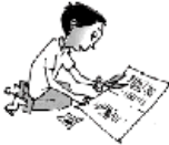
ടൂർസ് യുദ്ധത്തെപ്പറ്റി ഒരു ചർച്ച നടത്തുക.

അബ്ദുറഹ്മാൻ ഗാഫഖിയുടെ മരണത്തെത്തുടർന്ന് സ്പെയിനിൽ അരാജകത്വം സൃഷ്ടിക്കപ്പെടുകയും അറബികൾക്കിടയിൽ പഴയകാല വിഭാഗീയത ഉടലെടുക്കുകയും ചെയ്തു. ഇതിനെ തുടർന്ന് അധികാരത്തെച്ചൊല്ലി വടക്കൻ അറബികളും തെക്കൻ അറബികളും തമ്മിൽ നിരന്തര തർക്കങ്ങളുണ്ടായി. തുടർന്ന് പ്രശ്ന പരിഹാരത്തിനും അറബികളുടെ വ്യത്യസ്ത വിഭാഗങ്ങളായ ഖൈസരിയ്ക്കും യമനികളും തമ്മിൽ അവസാനം ഒരു കരാറിലെത്തുകയുണ്ടായി. തുടർന്ന് ഗവർണ്ണറുടെ കാലാവധി ഒരു വർഷമായി പരിമിതപ്പെടുത്തി. ഇതിന്റെയടിസ്ഥാനത്തിൽ സി. ഇ. 747 ൽ യൂസഫ് ബിൻ-അബ്ദുൽ റഹ്മാൻ അൽ ഫിഹരിയാണ് ഗവർണ്ണറായതെങ്കിലും ഒരു വർഷത്തിനുശേഷം അദ്ദേഹം സന്ദാനമൊഴിയാൻ വിസമ്മതിക്കുകയും സി.ഇ. 756 വരെ ഭരണം തുടരുകയും ചെയ്തു.