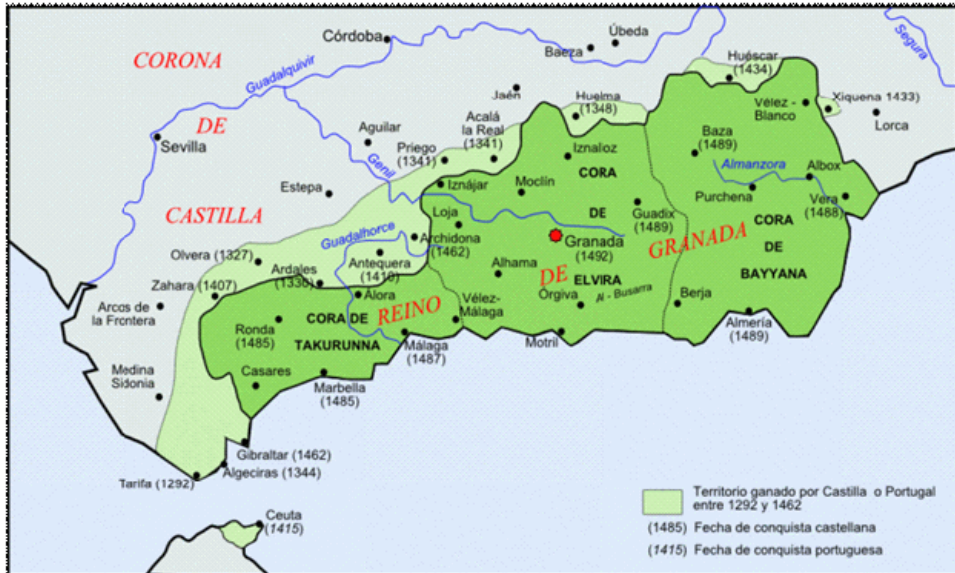
സ്പെയിനിലെ സന്ദ്രശ്ശ ഉമവി രാജവംശം

അബ്ദു റഹ്മാൻ മൂന്നാമനു ശേഷം അൽ ഹക്കം രണ്ടാമൻ സ്പെയിനിലെ ഭരണാധികാരിയായവു ന്നത് അദ്ദേഹത്തിന്റെ നാരീപത്തിയാറാം വയസ്സിലായിരുന്നു അതുകൊണ്ടുതന്നെ ഭരണപരമായ പരിചയം അദ്ദേഹത്തിനു വേണ്ടുവോളമുണ്ടായിരുന്നു. അദ്ദേഹത്തിനുശേഷംവന്ന മകൻ അബ്ദുൽ മാലിക് അൽ മുസാഫറിന്റെ (976-1008 സി.ഇ.) ഭരണത്തോടെ കൊർദോവയിലുണ്ടാ യിരുന്ന ഉമവി ഭരണം ക്ഷയിക്കാൻ തുടങ്ങി.