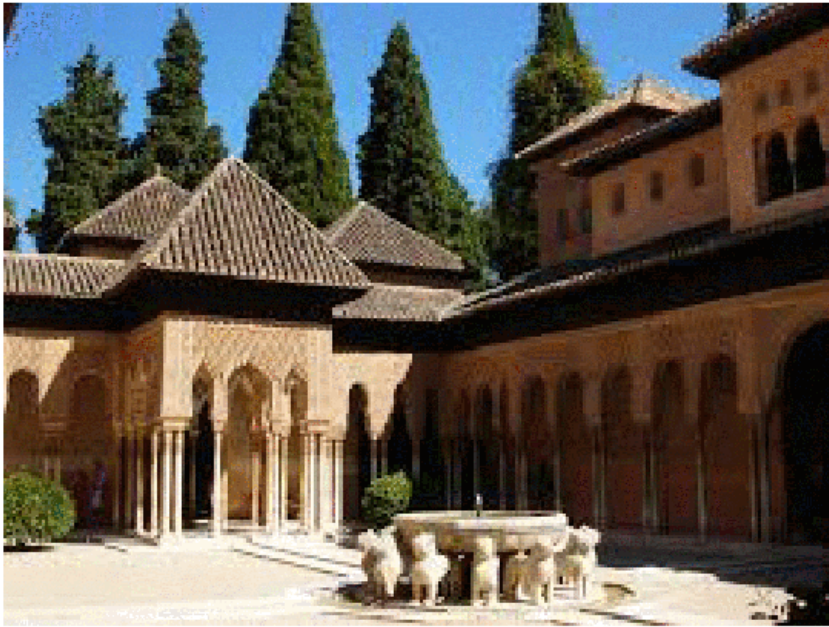
അൽ ഹംറ കൊട്ടാരം

അറബിക്, ക്രിസ്തീയമായ തനത് ശൈലികളുള്ള ഉപകരണങ്ങളിലും കാണാൻ സാധിച്ചിരുന്നു. സൈനികക്കിരണ്ടും, മൊസൈക്കിനന്റേയും രൂപങ്ങളും ടൈലുകളും സ്വപ്നനിഷ്കലയുടെ ഭാഗമായിരുന്നു. വ്യത്യസ്ത തരത്തിലുള്ള നിറങ്ങൾ സ്വപ്നയിനിലും ഘോരീട്ടുഗലിലും കൊണ്ടുവന്നത് അറബികളുടെ പാരമ്പര്യമായി കണക്കാക്കുന്നു.