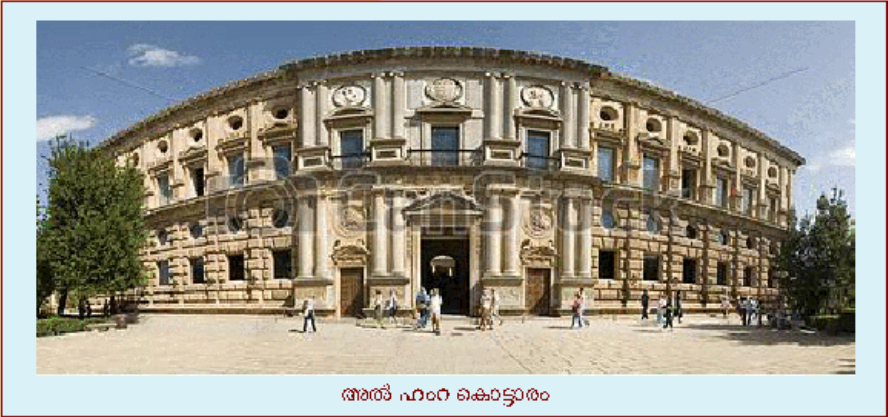
അൽ ഹംറ കൊട്ടാരം